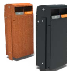
BORG 2 ENTRÉES 50L